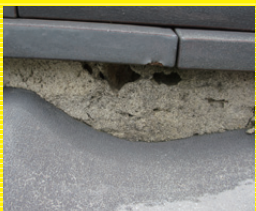
漆喰工事 1㎡ 2,000円より