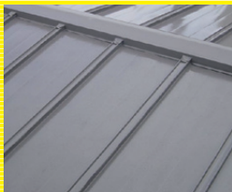
板金屋根葺き替え 1㎡ 4,000円より