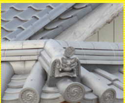
日本瓦葺き替え 1㎡ 8,000円より