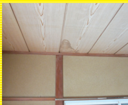
雨漏り部分修理 5,000円より

茨城県及び栃木県を中心に創業以来3000件上の修理実績を残しております。屋根診断士、一級技能士の資格を保有するノウハウと経験豊富な雨漏り修理のプロが対応します。