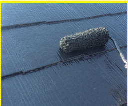
屋根の塗装 1㎡ 3,000円より